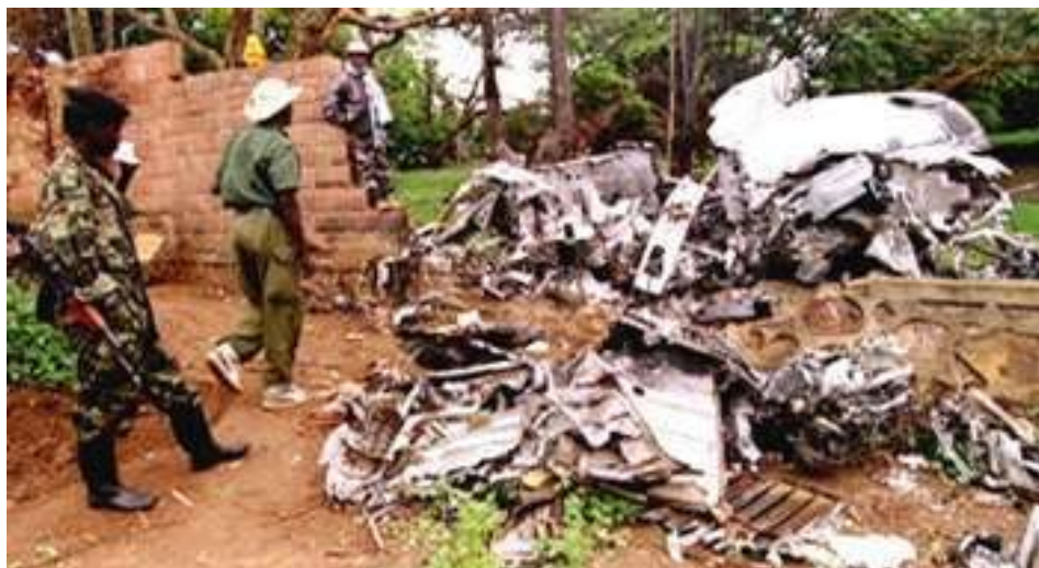
Restes de l'avion du président Rwandais, Juvénal Habyarimana.