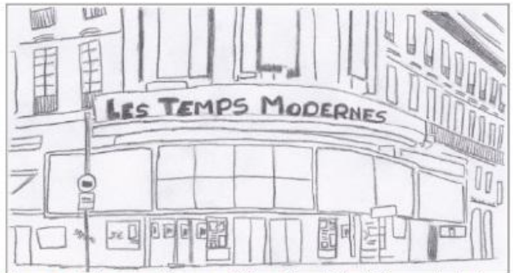
Vue panoramique du nouveau cinéma, avenue Williams, Taïpen. (dessin de Clémence et Antoine)