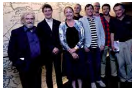
Les directeurs des festivals de la Word Alliance.

Des festivals qui en retour nourrissent le festival de Saint-Malo.