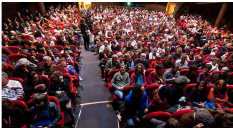
Le Théâtre de Saint-Malo avant le ciné-concert de Saul Williams en 2013.

Pendant 3 jours le festival investit les 5 salles du cinéma Le Vauban (868 places), l'auditorium du palais du Grand Large (1000 places), le théâtre Chateaubriand (380 places), les 3 salles de la nouvelle Médiathèque (350 places) et la petite salle de l'École Nationale Supérieure maritime (100 places). Afin d'améliorer les conditions de projection et le confort des festivaliers, nous poursuivons notre démarche vers le numérique en privilégiant la projection en DCP et bêta num.