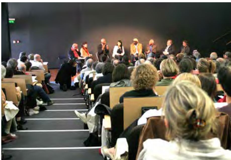
Grand débat à Saint-Malo en salle Maupertuis.

Étonnants Voyageurs, avec en sous-titre, dès la première édition, en 1990, en forme de manifeste: «Quand les écrivains redécouvrent le monde». Pour dire l'urgence, à nos yeux, d'une littérature aventureuse, voyageuse, ouverte sur le monde, soucieuse de le dire. Étonnants Voyageurs: sans considération de genres, roman, récit de voyages, B.D., science-fiction, poésie, roman noir, cinéma, photographie: le rendez-vous des petits enfants de Stevenson et de Conrad.