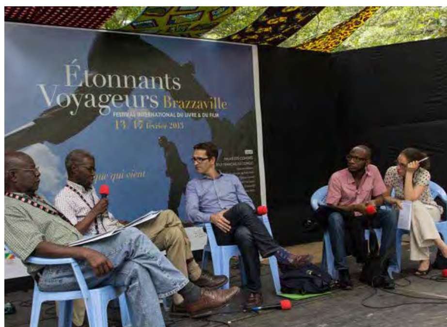
Débat «Afrique-Amérique» à Brazzaville en 2013.