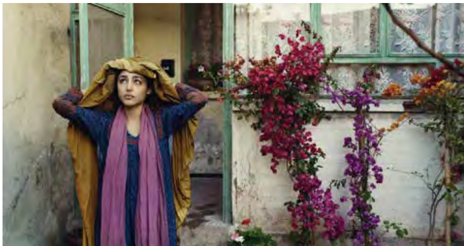
« Syngué Sabour » projeté à Saint-Malo en 2013.