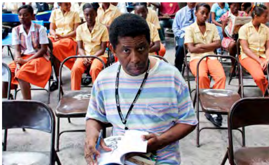
Dany Laferrière à Port-au-Prince en 2007.

La Word Alliance : pour un monde multipolaire, sans plus de centre dominant. La Terre pour la première fois devient ronde. Et ce n'est pas nécessairement une mauvaise nouvelle !