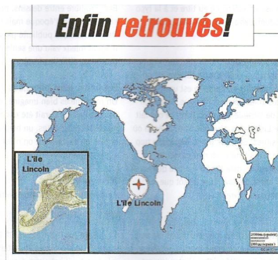
Une carte en dit souvent plus qu'un long texte.