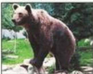
Un ours sur des rochers