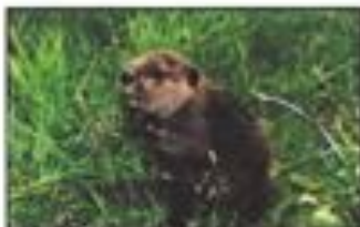
Un castor dans l'herbe.

Le castor est un animal sauvage qui vit en Amérique du Nord. Avant d'être tué par les indiens, le castor faisait des barrages pour être en sécurité dans son habitat. Les indiens le tuaient pour son pelage et le mangeaient.