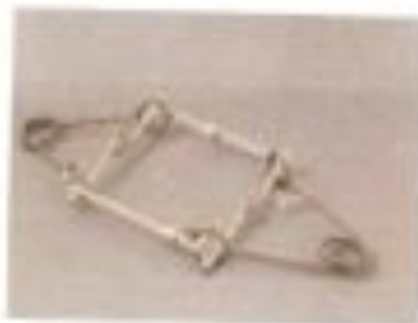
Piège à castors à prix bas. En bon état.

Chasser-survie-trapper- animal-monde-canada- rongeur-lac-armes