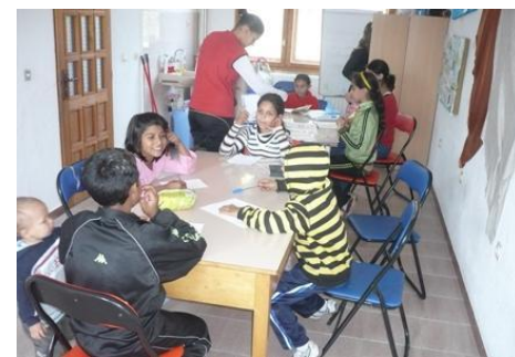
Courriel international 05/10/2010

Si nous nous appuyons sur le témoignage de G.Pau Langevin, militante de l'inclusion de Roms, nous pouvons affirmer que les mentalités peuvent évoluer.