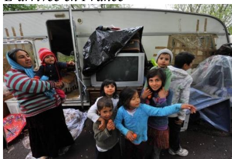
La voix du nord.fr 20/04/2009

Les Roms quittent leur pays à la recherche d'une vie meilleure dans l'espoir de trouver un travail pour avoir un salaire et nourrir leurs familles mais également pour les soins médicaux dont ils peuvent bénéficier. Lorsqu'ils arrivent en France, la réalité est souvent tout autre. Ils dorment dans des sortes de campements à la périphérie des villes, dans des terrains